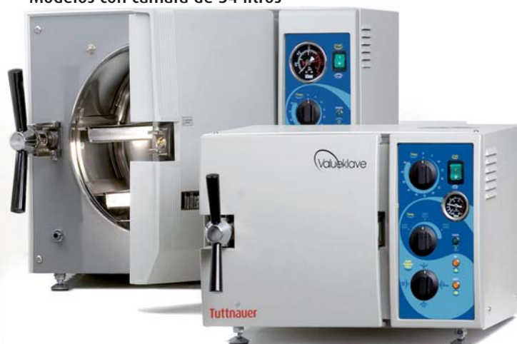
Modelos con cámara de 7.5 litros

Cumple con las más estrictas normas y directivas internacionales: