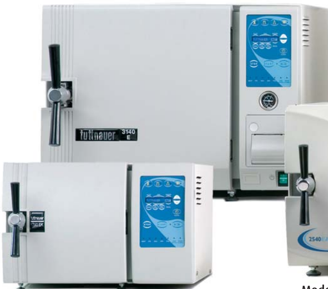
Modelos con cámara de 34 litros