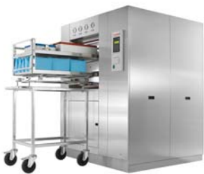
Esterilizadores de gran tamaño para distintas necesidades del mercado e industria

Tuttnauer presenta su gama de soluciones para esterilización, desinfección y limpieza: