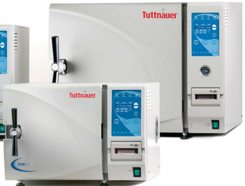
Modelos con cámara de 64 / 85 litros