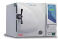
Esterilizadores de mesa con pre y post-vacío diseñados para realizar ciclos clase B

International Sales and Marketing E-mail: info@tuttnauer-hq.com www.tuttnauer.com