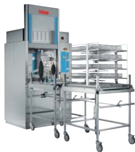
Lavadoras / desinfectadoras para hospitales y laboratorios