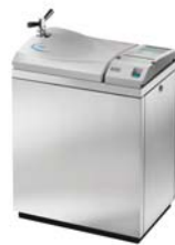
Autoclaves para laboratorio de distintos tamaños y aplicaciones