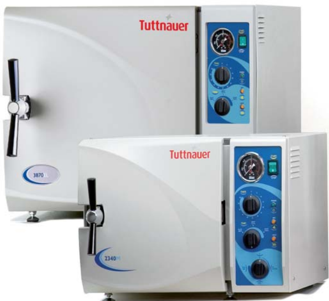
Modelos con cámara de 19 / 23 litros